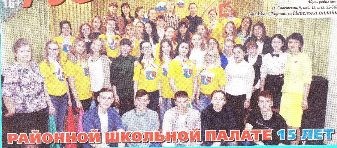
РАЙОННОЙ ШКОЛЬНОЙ ПАЛАТЕ 15 ЛЕТ

Движение активных школьников Болотнинского района набирает обороты. Сегодня в состав «Районной школьной палаты» входят объединения старшеклассников девятнадцати образовательных организаций района. Задействованы почти 600 старшеклассников.